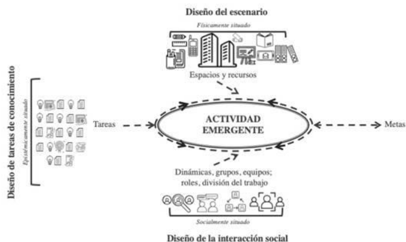
Diagrama del marco ACAD en castellano