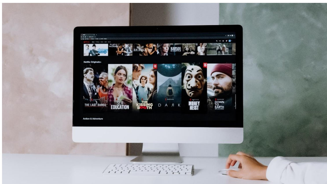
La plataforma de VOD más popular globalmente en la actualidad.

Las cifras apuntan a una tendencia. El nuevo entorno mediático, poliédrico, acelerado, multimodal, opaco, conectivo, invasivo, social, participativo, condicionante, creativo, interactivo, algorítmico, mutante... está ahí. Existe. Y cada vez se accede a él en edades más tempranas.