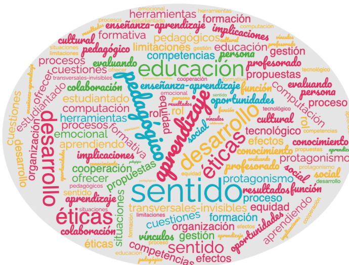
Figura 1 Nube de conceptos sobre interrogantes en torno a la IA